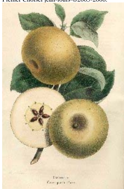
La Belgique horticole, 1854, Ch.Morren.